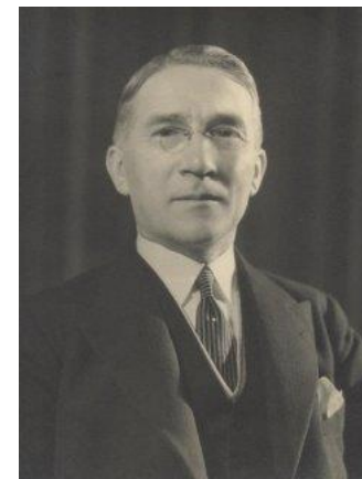
Kārlis Zariņš (1879-1963)