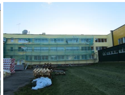
Kalnciema pagasta vidusskola