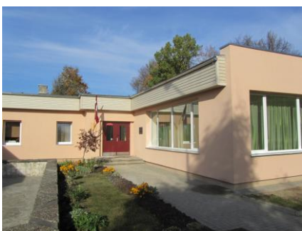
Glūdas pirmskolas izglītības iestāde „Taurenītis”

Galvenās aktivitātes: Oglekļa dioksīda emisiju samazinājums Staļģenes vidusskolas, Elejas vidusskolas, Glūdas pirmskolas iestādes „Taurenītis”, Sesavas pamatskolas, Kalnciema pirmskolas izglītības iestādes „Mārīte”, Kalnciema pagasta vidusskolas, Valgundes Bērnu un jauniešu centra ēkās, veicot ēku rekonstrukciju (ēku ārsienu, jumtu, grīdu, bēniņu siltināšana, logu, ārdurvju un jumta seguma nomaiņa u.c.)