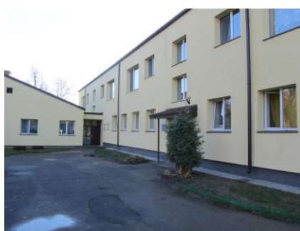
Kalnciema pirmskolas izglītības iestāde „Mārīte”