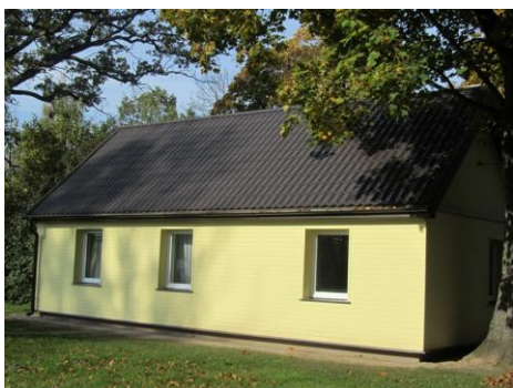
Mežciema sociālais centrs