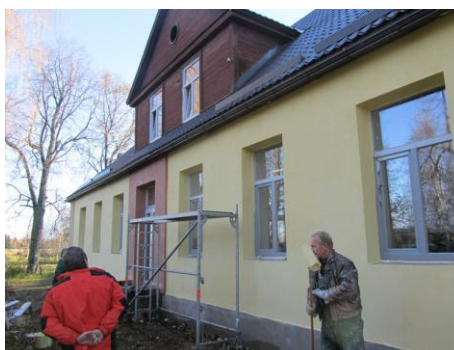
Valgundes „Ārstu Māja”