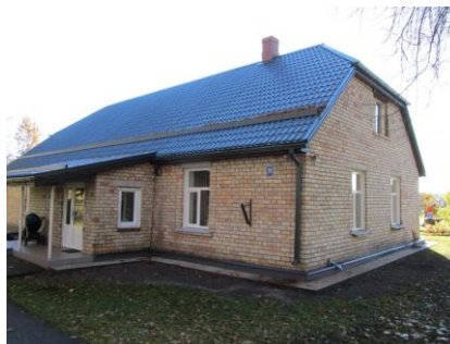
Valgundes Bērnu un jauniešu centrs