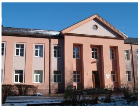
Kalnciema veselības un sociālās aprūpes centrs