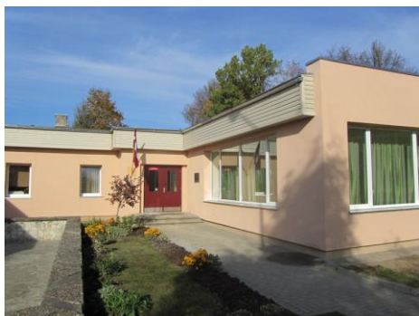
Elejas bērnu un ģimeņu centrs

Galvenās aktivitātes: veikt ēku rekonstrukciju (ēku ārsienu, jumtu, grīdu, bēniņu siltināšanu, logu, ārdurvju un jumta seguma nomaiņu u.c.) Mežciema sociālajā centrā, Elejas bērnu un ģimeņu centrā, Kalnciema veselības un sociālās aprūpes centrā, Valgundes „Ārstu Mājā”